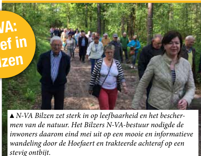
▲ N-VA Bilzen zet sterk in op leefbaarheid en het beschermen van de natuur. Het Bilzers N-VA-bestuur nodigde de inwoners daarom eind mei uit op een mooie en informatieve wandeling door de Hoefaert en trakteerde achteraf op een stevig ontbijt.