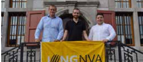
Dynamisch nieuw jongerenbestuur p.2