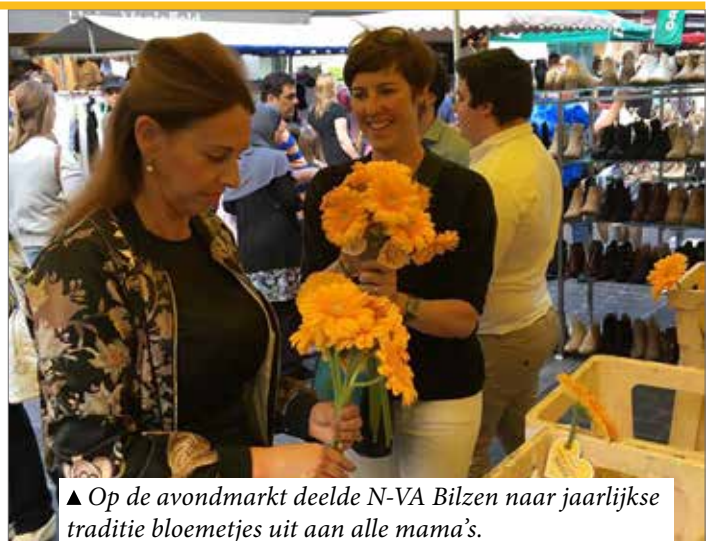
▲ Op de avondmarkt deelde N-VA Bilzen naar jaarlijkse traditie bloemetjes uit aan alle mama's.