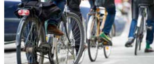
Vlaanderen investeert in Bilzers fietsplezier p.3