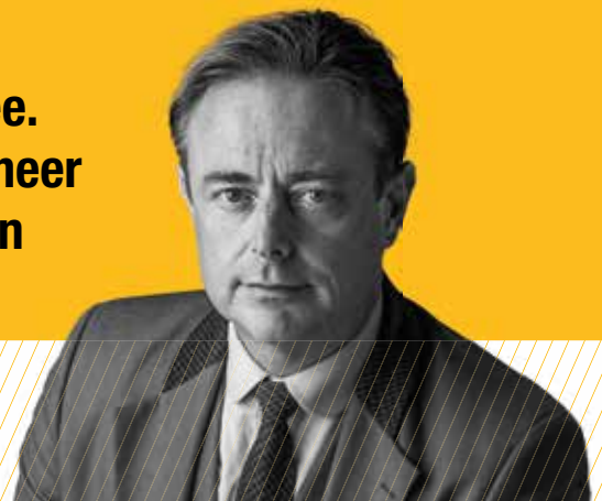
Bart De Wever Voorzitter

Bij de N-VA telt uw stem wél mee. De N-VA zal de komende jaren meer dan ooit waken over de belangen van álle Vlamingen.