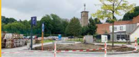
Vernieuwing Jazz Bilzen-plein gemiste kans (p.2)