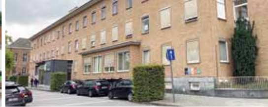
Asielcentrum in centrum van Bilzen? (p.3)